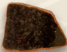
CAFÉ OSCURO 2