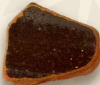
CAFÉ OSCURO 1